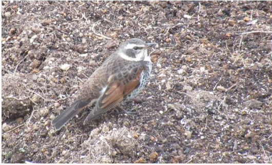
名前：ツグミ 様子：堆肥置き場の上、畑の上、芝生の上をピョンピョンと跳ねまわりながら食べ物を探していました。 見つけた場所：エコセンター堆肥置き場