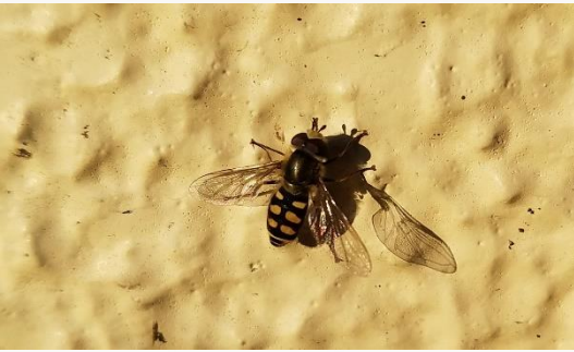
名前：フタホシヒラタアブの仲間 様子：芝生の上を少し飛んだ後に壁に止まって日光を浴びていました。ミツバチが見られない冬でも活動します。 見つけた場所：エコセンターの壁