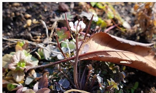
名前：タネツケバナの仲間 様子：同じアブラナの仲間のナズナと一緒に畑の中で花を咲かせていました。アブラナに似た小さな実をつけます。 見つけた場所：畑の土の上