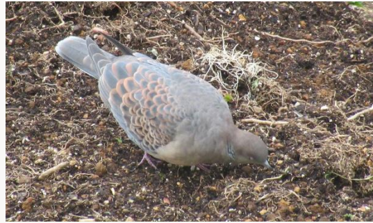
名前：キジバト 様子：堆肥置き場の上やその周りをさかんに掘り返しながら食べ物を探していました。 見つけた場所：エコセンター堆肥置き場