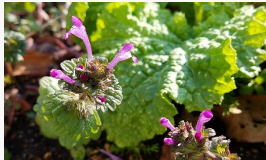
名前：ホトケノザ 様子：農園の畑の中で何本かが顔を出して紫の花を咲かせていました。同名の春の七草とは別種。 見つけた場所：畑の土の上