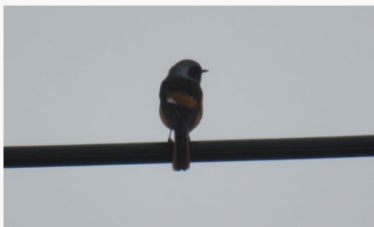
名前：ジョウビタキ 様子：桜の木の上でヒッ、ヒッ、ヒッと鳴いた後、電線の上に飛び上がりました。10月の終わりから来ていたようです。 見つけた場所：エコセンター付近の電線