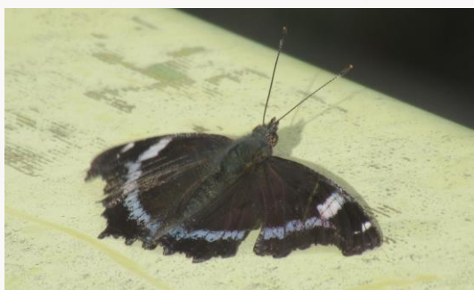
名前：ルリタテハ 様子：エコセンターの建物の周りを飛び回り、時々とまっては翅を拡げて日光を浴びているようでした。 見つけた場所：農園の水道の近く