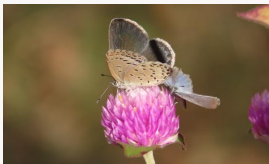
名前：ヤマトシジミ 様子：農園のセンニチコウの花に10個体前後が集まっていました。写真の左が雌、右が雄でしょうか。 見つけた場所：農園のセンニチコウ