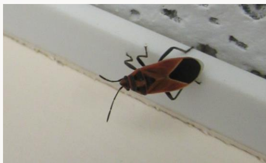
名前：ヒメマダラナガカメムシ 様子：いつの間にか環境課の事務室の中に入り込んでいました。写真を撮ろうとするどどこかに逃げていきました。 見つけた場所：エコセンター2階事務室