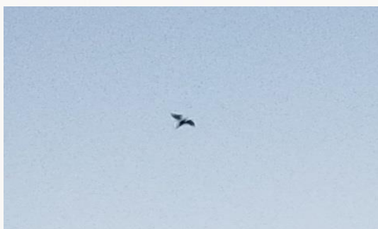
名前：アブラコウモリ 様子：あらかわエコセンターの上を何回も旋回して飛び回っていました。餌の昆虫を探していたのでしょうか 見つけた場所：エコセンター駐輪場上空