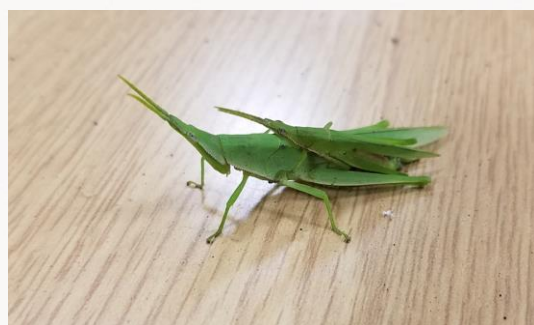
名前：オンブバッタ 様子：実習室の机の上で雌が雄をおんぶしていました。三河島枝豆にくっついて来たのかもしれませんが。 見つけた場所：エコセンター実習室