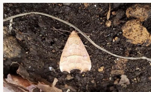
名前：アカキリバ 様子：サツマイモの蔓刈りの作業をしていたところ、三角形の落葉のような体で飛び出してきました。 見つけた場所：農園のサツマイモ畑