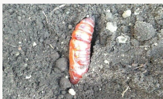
名前：スズメガの仲間の蛹 様子：サツマイモを掘ると大きな蛹が見つかりました。幼虫がサツマイモの葉を食べるエビガラスズメと思われます。 見つけた場所：農園のサツマイモ畑