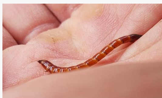
名前：コメツキムシの仲間の幼虫 様子：収穫したサツマイモにくっついて来ました。害虫として知られるマルクビクシコメツキと思われます。 見つけた場所：農園のサツマイモ