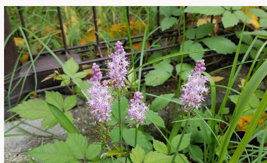
名前：ツルボ 様子：農園の金網の傍にたまった土から伸びてピンク色の花を咲かせていました。10株くらいが育っていたようです。 見つけた場所：農園のミニトマト