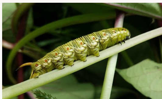
名前：エビガラスズメ 様子：サツマイモの蔓返しの作業をしていたところ、茎に大きな幼虫が見つかりました。 見つけた場所：農園のサツマイモ