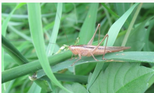
名前：ササキリの仲間 様子：農園の堆肥置き場に育ったメヒシバなどのイネ科植物にとまっています。ウスイロササキリと思われます。 見つけた場所：農園の枝豆の葉の上