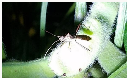
名前：ホソヘリカメムシ 様子：枝豆の害虫として知られており、農園で育てた三河島枝豆の鞘に口を突き立てて汁を吸っていました。 見つけた場所：農園の三河島枝豆