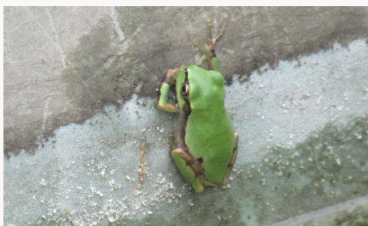
名前：ニホンアマガエル 様子：3階テラスのビオトープで育ったオタマジャクシに脚が生えて上陸したようです。体長は1cmちょっとくらい。 見つけた場所：エコセンター3階テラス