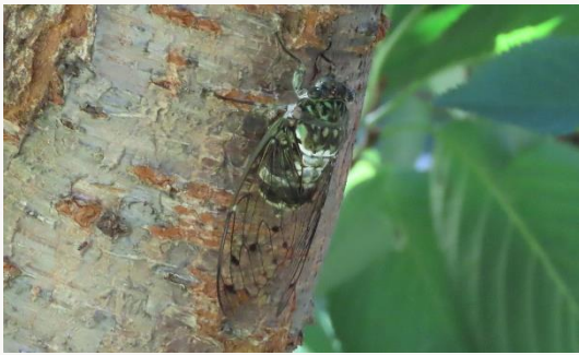
名前：ミンミンゼミ 様子：エコセンターに何本が植えられている桜の木からミン、ミン...と大きな鳴き声が聞こえてきました。 見つけた場所：農園の桜の木