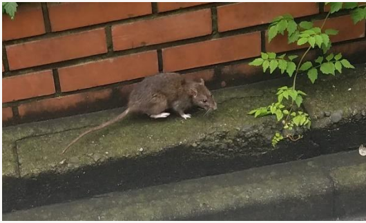
名前：ドブネズミ 様子：エコセンターの周りの道路をノソノソと歩いていました。カメラを向けると一目散に逃げていきました。 見つけた場所：エコセンター西側道路