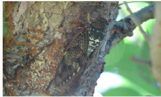
名前：アブラゼミ 様子：ジジジジ...と油を揚げる音に似た声が聞かれましたが、今年はミンミンゼミのほうが目立っていたかも。 見つけた場所：農園の桜の木