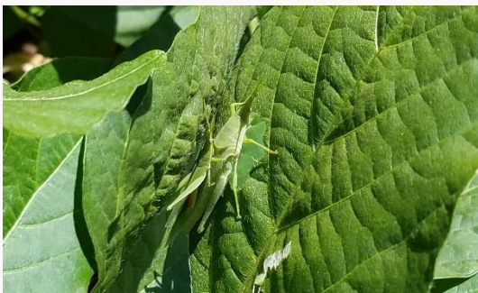
名前：オンブバッタ 様子：小さな雄をおんぶしたまま、大きな雌だけが枝豆の葉を食べていました。 見つけた場所：農園の枝豆の葉の上