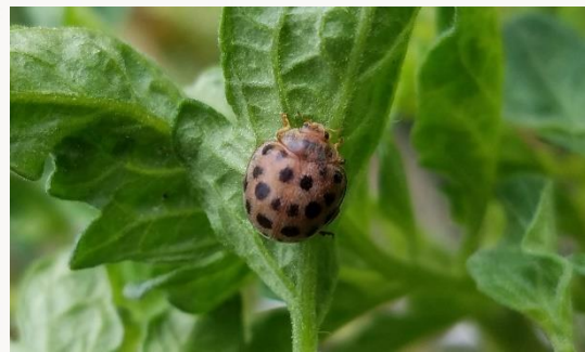
名前：ニジュウヤホシテントウ 様子：ナスやトマトの仲間の害虫として知られています。エコセンターでは初めて見つかったかもしれません。 見つけた場所：農園のミニトマト