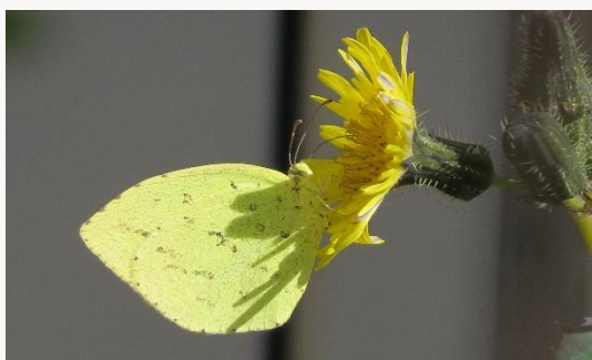
名前：キタキチョウ 様子：農園を飛び回りながら、花を探しては吸蜜していました。うまく冬を越せたようです。 見つけた場所：ノゲシの花の上