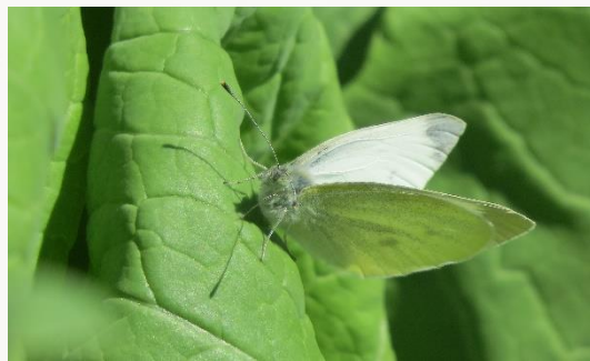
名前：モンシロチョウ 様子：三河島菜や小松菜の周りを飛び回っていました。 見つけた場所：農園の三河島菜の上