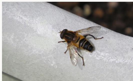
名前：アシブトハナアブ 様子：プランターの縁でじっと太陽の光を浴びてウォーミングアップしているように見えました。 見つけた場所：農園のプランターの上