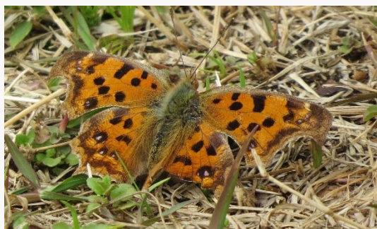
名前：キタテハ 様子：この日は同時に3個体見られました。他のキタテハやモンシロチョウを追っ払っていたようです。 見つけた場所：農園の芝地