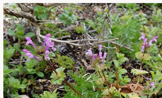
名前：ホトケノザ 様子：暖かい日が続いた後に紫色の花を咲かせていました。春の七草のホトケノザとは別の植物です。 見つけた場所：農園の畑