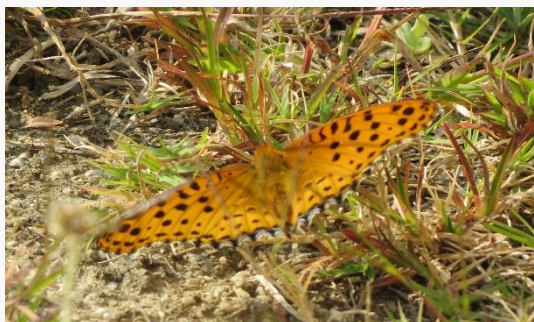
名前：ツマグロヒョウモン 様子：他の個体と追いつ合いながら飛んだり止まったりしていました。 見つけた場所：農園の芝地