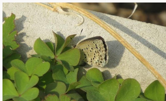
名前：ヤマトシジミ 特徴：カタバミの葉に向かってお尻を曲げていました。産卵中でしょうか。 見つけた場所：プランターのカタバミ