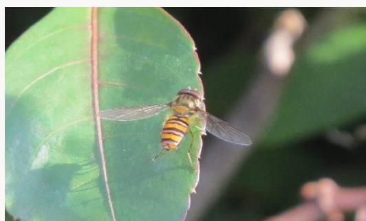
名前：ヒラタアブの仲間 特徴：ミツバチの仲間があまり見られないほど気温が下がってもヒラタアブの仲間は飛んでいるようです。 見つけた場所：壁面緑化植物の上