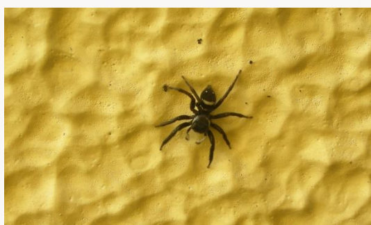
名前：アダンソンハエトリ 特徴：エコセンターの事務室の中でもよく見られる人気者のクモです。 見つけた場所：エコセンターの壁