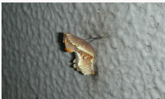
名前：ジャコウアゲハの蛹 特徴：ウマノスズクサを食べるのがよく見られた幼虫が蛹になりました。 見つけた場所：エコセンターの壁