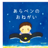
▲絵本「あらペンのおねがい」