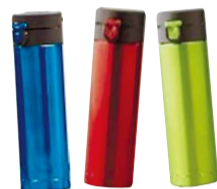
▲真空ステンレスボトル