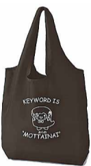
▲あら坊オリジナルエコバッグ