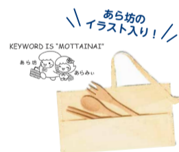
▲カトラリーセット