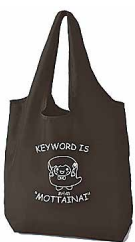
▲あら坊オリジナルエコバッグ