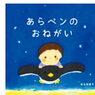
▲絵本「あらペンのおねがい」