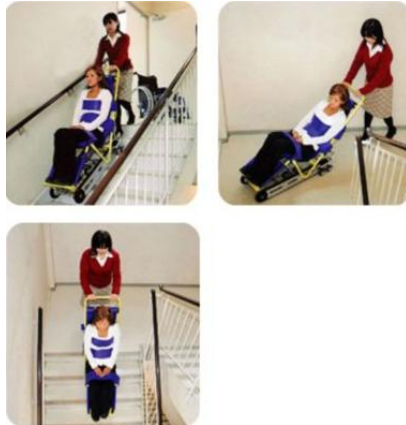
階段避難車（階段補助器具）