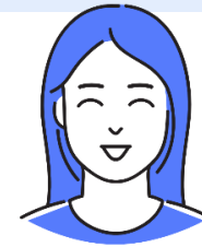
サービス業・経営者