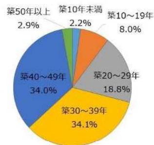
65歳以上の高齢者のみの住戸の割合×築年