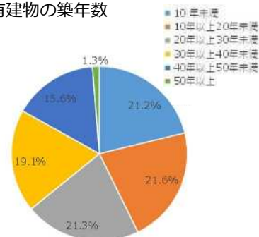
区分所有建物の築年数

マンション個々が抱えている問題を解消するため、適正な維持修繕の重要性や、支援制度について周知・啓発が必要な状況にあります。