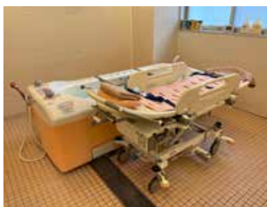
◀スクラムあらかわの 入浴設備

答 スクラムあらかわの体制の強化による利用定員の拡大について、事業者と協議していくほか、巡回入浴についても、委託事業者の拡充等、利用しやすい環境整備について検討していく。