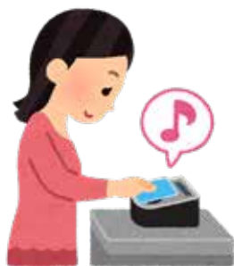
◀ キャッシュレス決済

答 区内の消費拡大に対する効果が限定的なため、区独自に事業を実施することは困難と考える。引き続き、都の動向も注視し、対応を検討していく。