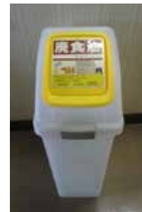
◀廃食油の回収ボックス (区内各所に設置)

答 専用ボトルの管理方法等、課題もあるが、廃食油のリサイクルについて事業者の取り組みや区内での展開も注視し、調査研究を行っていく。