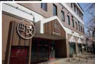
▶財政援助団体施設写真(町屋文化センター)