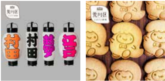
◀ふるさと納税 返礼品(例)

答 今年度新たに二つの民間ポータルサイトを利用できるようにするなど、寄付額の拡大につなげている。今後も様々な工夫を重ねながら、最大限の効果が得られるよう、取り組みを進めていく。