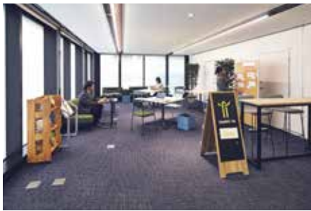
◀コワーキングスペース「ツムギバ」 (ふらっとにっぽり内)

答 区では、創業相談や創業支援融資、コワーキングスペース「ツムギバ」の運営等を実施しており、創業後も、伴走型の相談支援を継続するとともに、融資斡旋の実施等、経営基盤強化の支援も実施している。設備投資補助の要件である、5年以上の事業継続年数の緩和については、国や他自治体の事例も参考にしながら検討していく。