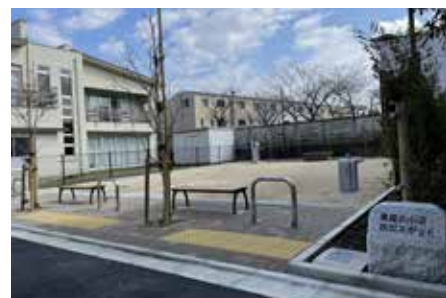
◀東尾久小沼防災スポット