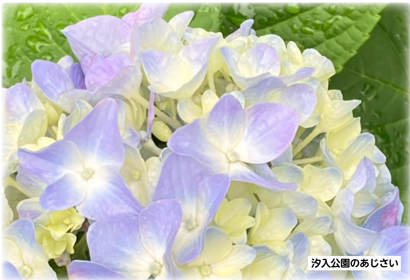
汐入公園のあじさい