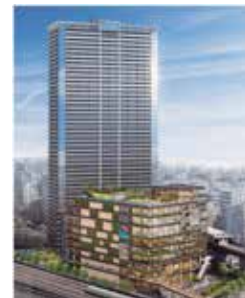
▲西日暮里駅前再開発イメージ図

答 令和4年11月に参加組合員の選定を開始し、評価のポイント等は準備組合の総会で公表され、建設環境委員会でも報告したところである。