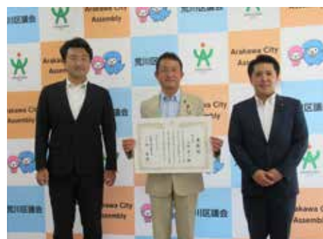
◀(左から)副議長、 小坂議員、議長

6月14日に開催された第99回全国市議会議長会定期総会において、永年勤続議員として、荒川区議会からは1名の議員が表彰されました。