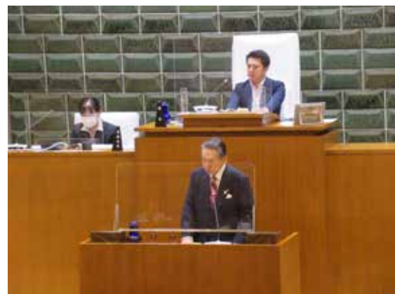
◀6月会議における 区長挨拶

6月会議では、区長から提出された議案15件がいずれも原案どおり可決・同意されました。(議案の審議結果は15ページに掲載しています)