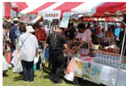
◀川の手荒川まつり(ふるさと市)