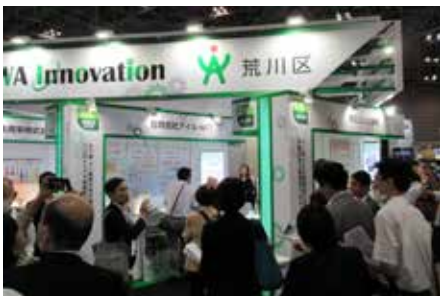
◀機械要素技術展 視察の様子