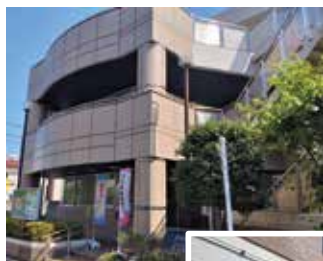
▶財政援助団体施設写真(シルバー人材センター)