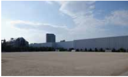
◀東尾久運動場 (多目的広場)