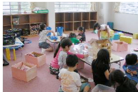
◀放課後児童事業 (汐入児童クラブ)