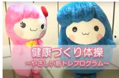
健康づくり体操 (荒川区YouTubeチャンネル)

答 区では、コロナ禍によりフレイル対策の重要性がさらに増したことから、様々な工夫を凝らして各種取り組みを進めてきた。第9期高齢者プランの策定にあたり、関係部署・団体との連携を更に深めながら、地域のあらゆる資源を活用することで、必要な施策を強力に推進していく。