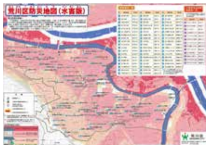
◀荒川区防災地図(水害版)