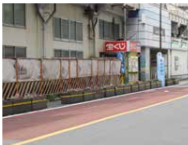
▲藍染川通りのプランター

答 プランターをガードパイプに変更する作業を花の木交差点から順次進めており、京成町屋駅の周辺についても準備をしているところである。