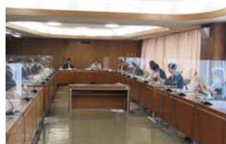
◀議会運営委員会の様子