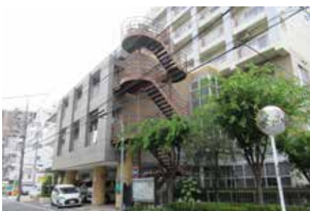
◀町屋在宅高齢者通所サービスセンター