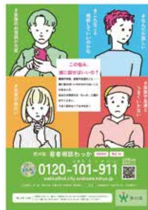
▶荒川区若者相談「わっか」(チラシ)