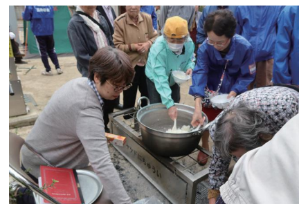
← ご飯の炊きあがり 早速試食タイム