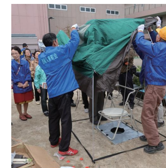
← トイレの テントを 組立て中