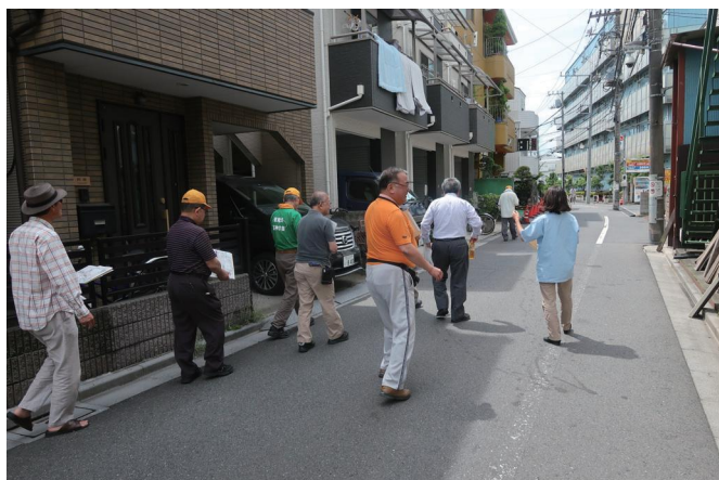
↑ 避難活動の中心となる道