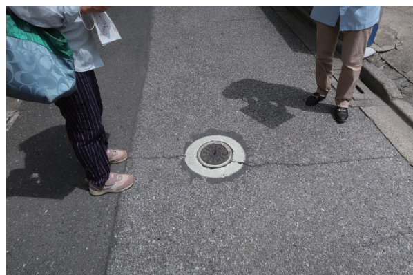
↑ 浮き上がっている水道栓