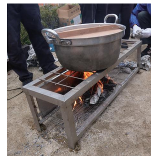
← かまどの完成 新聞紙も燃料に使えます