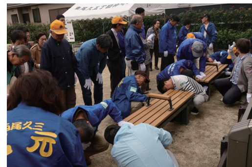
← ベンチの中の かまどを 取り出し