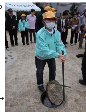
マンホール の蓋を 開けます→