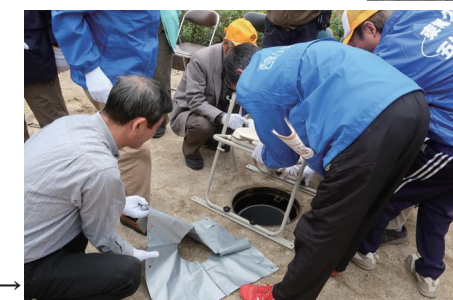
トイレの 便座を 組立て中→