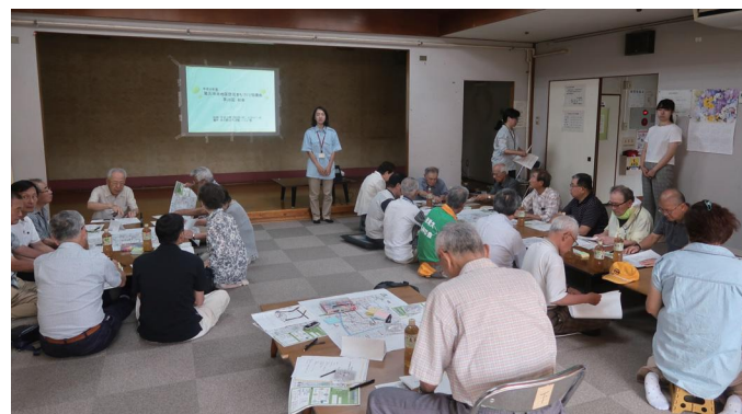
↑ 出発前に作戦会議

第1回協議会では、防災地図を持ってまち歩きを行い、地図の内容を確認すると共に、改めてまちの点検をしました。当日は3つのグループに分かれ、一時集合場所への行き方を確認しながら、周辺にあるAEDや防災スポット等の設備を確認、さらには、避難に支障となる危険な箇所を再点検しました。道路が狭いことが再確認されたところが多く、また、大阪府北部地震で改めて注目されたブロック塀も各所で目につきました。まち歩きの結果をふまえ、今後防災地図を更新していきます。