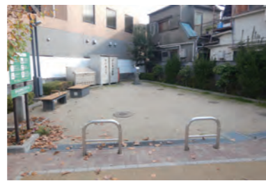
花の木防災スポット