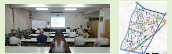
協議会での検討の様子と結果

2月に図上で検討した、「避難路として使用できそうな道路」を現地確認する方針となり、実施方法や内容を検討しました。