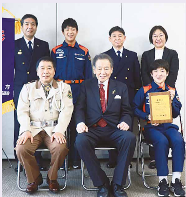
▲荒川消防少年団・荒川消防署の皆さんと西川区長