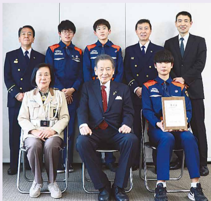
▲尾久消防少年団・尾久消防署の皆さんと西川区長