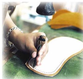
▲靴屋 shiro でのスリッパ製作の様子