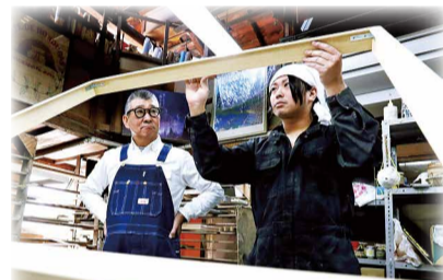
▲株式会社富士製履での額縁製作の様子