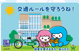
▲図書カード(イメージ)

区内の自転車安全整備店で赤色または緑色TSMマークを取得して、区に申請をされた方に、図書カードを差し上げています。