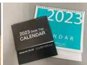
左卓上カレンダー、右ポケット付きカレンダー