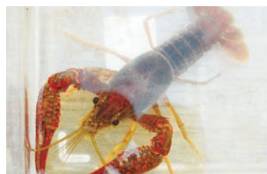
▲アメリカザリガニ