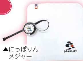
ふらっとにっぽりオリジナルハンドメジャー

自身のSNS (Instagram、Twitter、Facebook、LINE、TikTok等) で、ふらっとにっぽり大階段アートの写真・動画を投稿した方に、オリジナルグッズ (右写真) を差し上げます。 ※1人1日1回のみ (複数のSNSへの投稿も1回) ※なくなりしだい終了