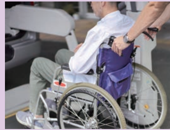
◀充実と支援が求められる介護・福祉サービス

9条改憲、大軍拡と増税、介護など社会保障削減の動きを許しません。日本国憲法の国民主権、基本的人権、生存権、平和主義などを守り、暮らしと区政に生かし、希望を切り開く年にするため頑張ります。みなさんのご支援をお願いします。