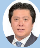
☉ まちだ たかし 町田 高