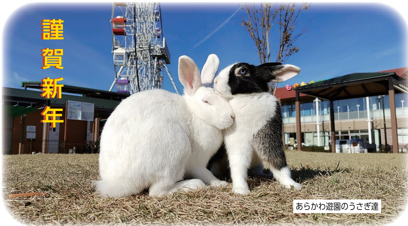
あらかわ遊園のうさぎ達