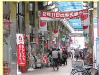
物価高騰等への対策に 取り組む区内商店街の様子

今年4月には「高校三年生までの医療費無償化」が実現します。防災対策や脱炭素対策も急務の課題です。これからも我が党が誇る「生活現場の小さな声を聴く力」「ネットワークを生かした政策実現力」を磨きに磨き、大衆の声を政治に活かす公明党の存在を発揮してまいります。