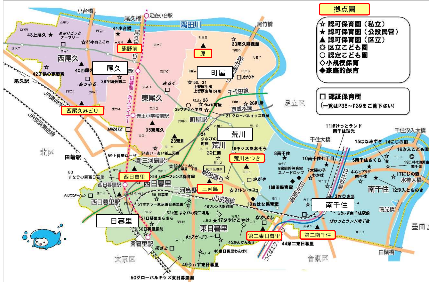
【拠点園配置エリア図】