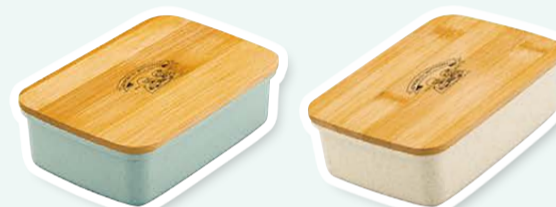
▶バンパーファイバー配合あらかわオリジナル保存容器(色の選択は不可)