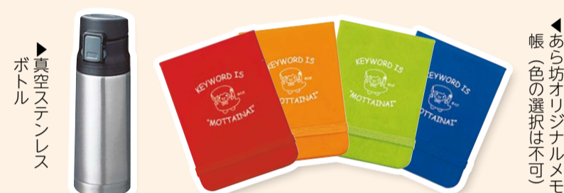
▶真空ステンレスボトル