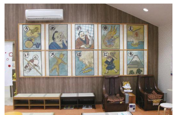
カルタ絵のある待合室(梅の湯)

梅の湯は昭和26年創業。8年前に建て替えを行い、銭湯らしい高い天井を維持し、開放感ある露天風呂やサウナ、高濃度水素風呂などを設置。創業時からある「カルタ絵」も待合室の壁に残しながら施設の魅力アップを図りました。商店街に所属し、地域の夏祭りなどにも参加。近隣の小学校の職業体験などにも協力しています。