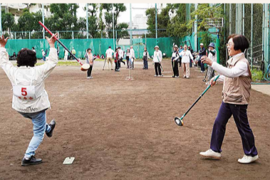
▲グラウンド・ゴルフ