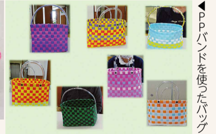
▲PPバンドを使ったバッグ