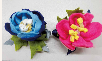
▲手作り教室(フェルト花)