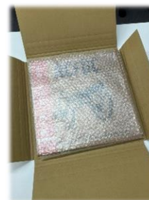
レコード梱包の様子