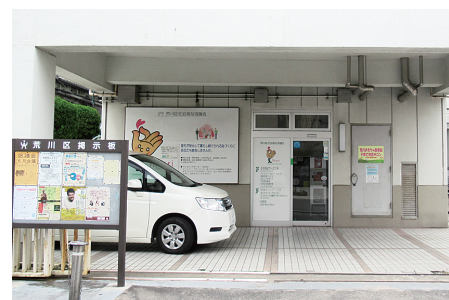
◀財政援助団体の一つである荒川区社会福祉協議会