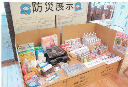
◀7日分の備蓄品展示と段ボールベッド