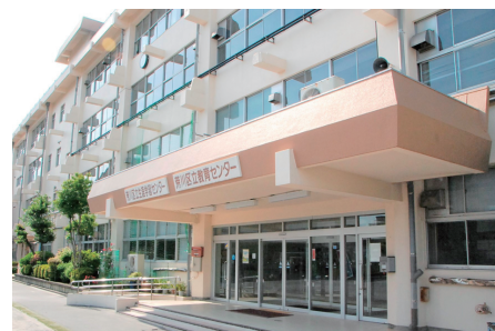
◀荒川区立生涯学習センターの外観