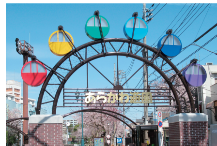
◀あらかわ遊園都電側ゲート