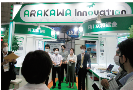
◀機械要素技術展での研修の様子