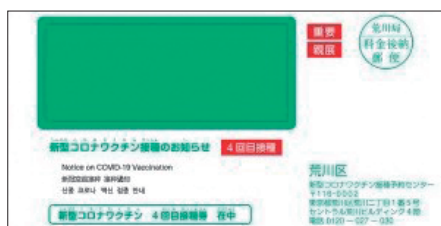
◀ワクチン接種(4回目接種)お知らせの封筒