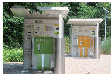
三河島駅前自転車駐車場の様子

No. 272 (令和4年6月19日発行) の5ページにおいて建設環境委員会の委員長の氏名に誤りがありました。お詫びして、訂正いたします。