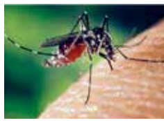
ヒトスジシマカ