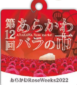
▲このタグが目印です