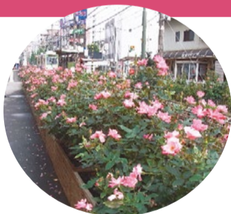
◀町屋駅前バラ花壇

交換期間 ▶5月17日(火)～荒川公園展示場 交換場所 ▶5月18日(水)～20日(金) …区役所北庁舎2階土木管理課