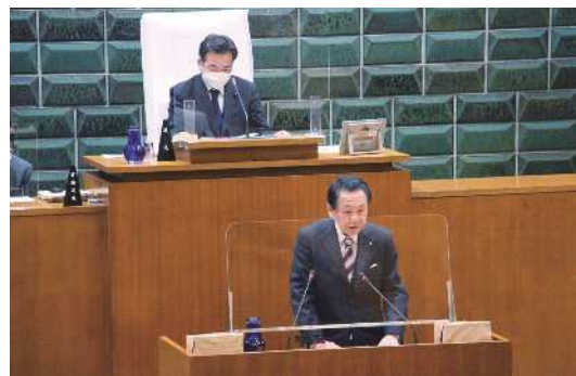
◀2月会議での区長挨拶の様子