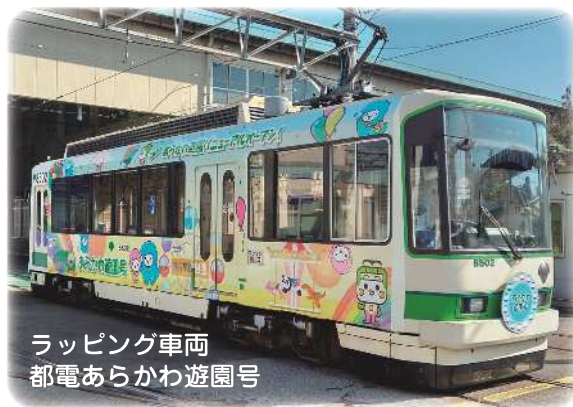
ラッピング車両 都電あらかわ遊園号