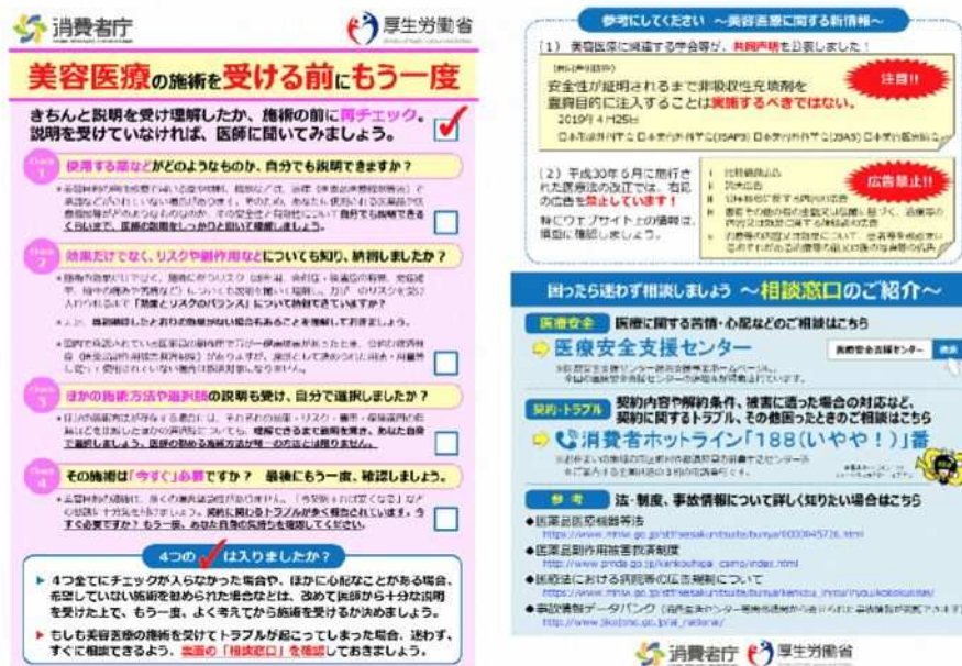
(消費者庁と厚生労働省による美容医療に関する注意喚起の資料)