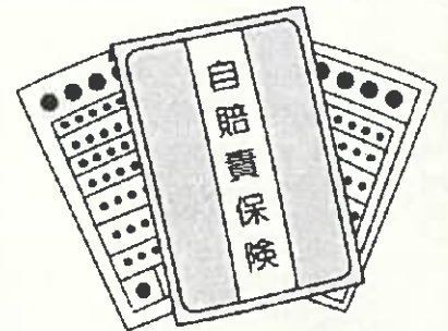
自賠責保険(共済)の加入