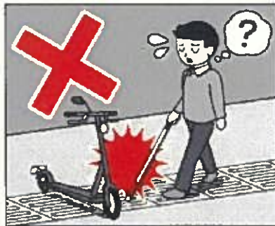
飲酒運転、放置禁止