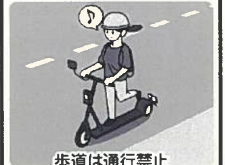
歩道は通行禁止 車道の左側を通行