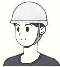
ヘルメットの着用