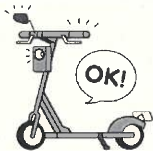
ブレーキ、前照灯、 バックミラー等が法令に適合