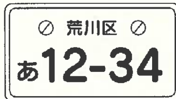
ナンバープレートの取付