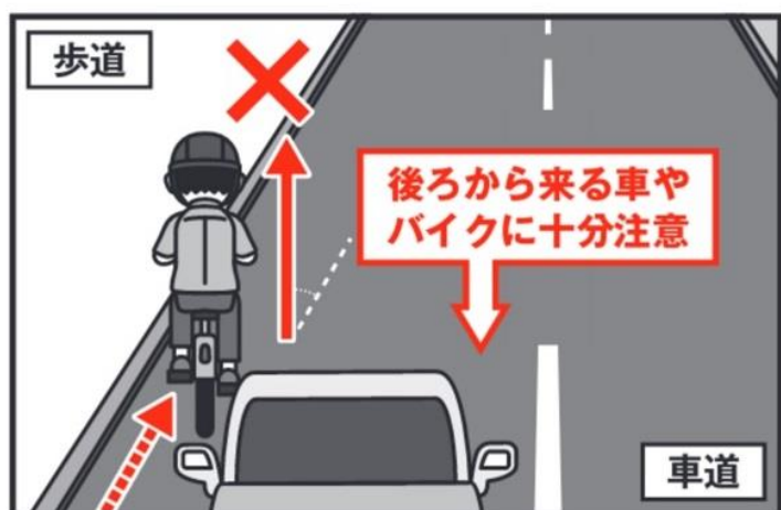
悪い例(進入角度が浅い)