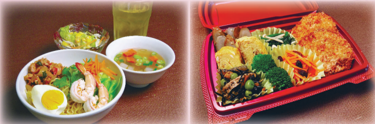
▲あらかわ満点メニュー