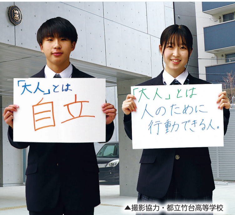
▲撮影協力・都立竹台高等学校

民法の改正による成年年齢の引き下げが行われ、令和4年4月1日から、18歳以上の方が成年になります。成年になると、保護者の同意がなくても自身の意思でさまざまな契約ができるようになる等、「できること」が増えますが、同時に大きな責任を負うことも増えてきます。