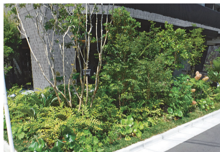
▲第11回の緑化計画部門受賞「緑・花」