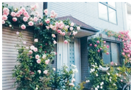
▲第11回の一般部門受賞「緑・花」

応募方法 持参・郵送・電子メールで、応募用紙を、〒116-8501(住所不要)荒川区役所土木管理課維持みどり係 ✉michi-midori@city.arakawa.lg.jp