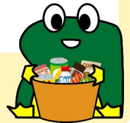
荒川区リサイクルキャラクター りっくる