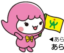
◀あら坊の妹 あらみい