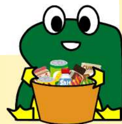
荒川区リサイクルキャラクター りっくる