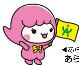
◀あら坊の妹 あらみい