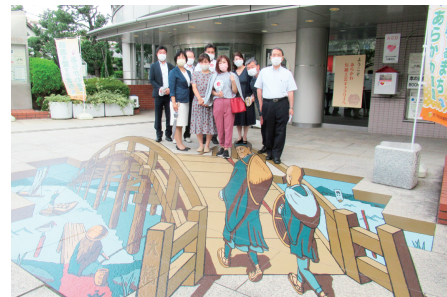
◀ふるさと文化館視察の様子(女関前のトリックアート)