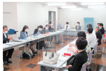
◀シルバー人材センターにて委員会を開会する様子