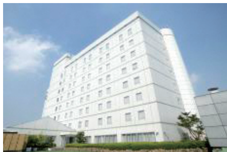
◀区内ホテルとの災害時の協定締結