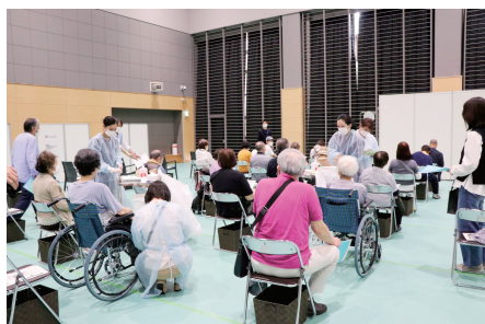
◀新型コロナウイルス対策経費を含む補正予算を緊急に議決