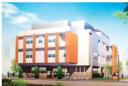
◀東尾久本町通りふれあい館 (完成予想図)