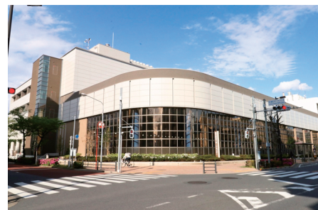
◀リニューアル後の荒川総合スポーツセンター