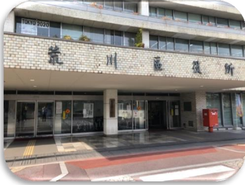
①区役所正面入り口