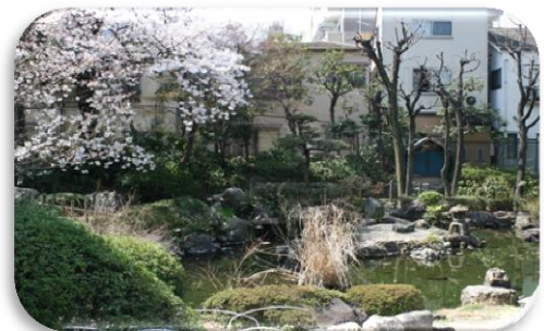
④日本庭園(区役所正面を出て右手側)

春には桜、5月中旬から6月上旬にはバラ、秋には紅葉を楽しむことができます！5月にはあらかわバラの市が開催され色とりどりのバラが咲き誇ります。四季折々の自然とともに記念撮影されてはいかがでしょうか。