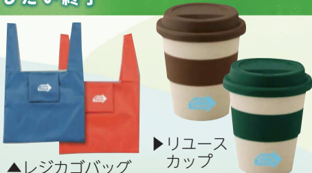
▲レジカゴバッグ ▶リユースカップ

COOL CHOICEに賛同した方やメッセージボードに記入した方へ、「COOL CHOICE ロゴ入りノベルティ」等を差し上げます。