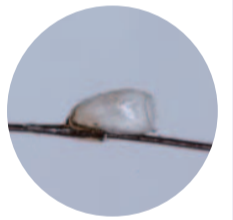
▲アタマジラミの卵の抜け殻