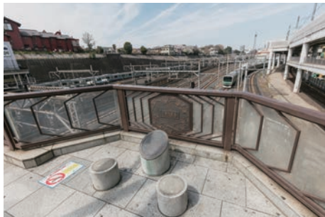
下御隠殿橋の トイレミュージアム

答 紅葉橋へのエレベーターとエスカレーターの設置は可能であることが分かってきたが、工事費が膨大となる点などの課題がある。関係機関と連携し協議を進めながら、補助金の確保についても国や都へ働きかけていく。また、中層スラブについては、鉄道関連の用途以外の活用は難しく、かつ、人の立ち入りを想定しておらず、安全性の確保には多額の経費が必要となる。課題は多くあるが今後も調査・研究を重ねていく。