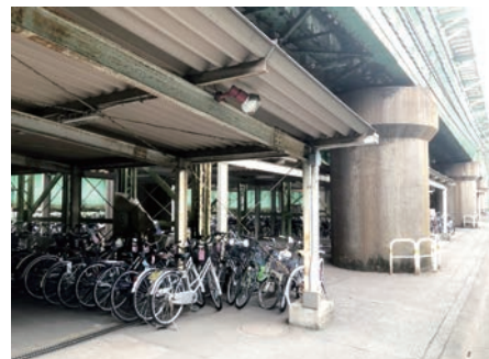
◀撤去された自転車を保管する三河島自転車保管場所