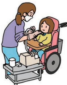
医療的ケア児とその家族への支援

問 栄養を注入する胃ろうやたんの吸引など、医療的ケアを必要とする「医療的ケア児」支援のための各関係機関の協議の場の設置をすべきと考えるが、区の見解を問う。