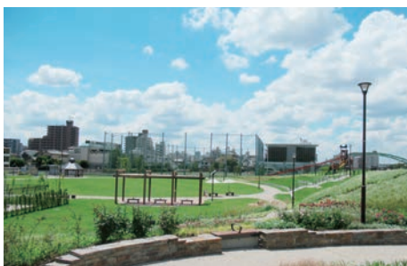
◀4月にオープンした 宮前公園第一期整備区域