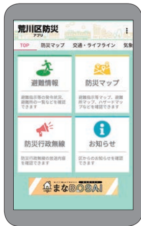
◀新しくリリースされた 荒川区防災アプリ（トップ画面）