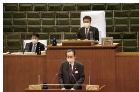
◀6月会議の区長答弁