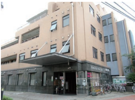
◀花の木ハイム荒川の外観