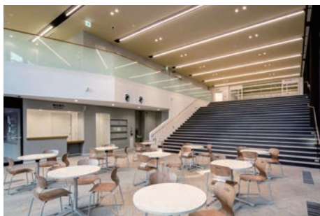
◀ふらっとにっぽり おもてなしスペース

地域と一体となり盛り上げる役割を担っていく。貴重な産業及び観光資源である繊維街の魅力を十分に発揮できるよう、「ふらっとにっぽり」を運営していく。