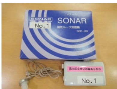
ゆいの森にて、磁気ループシステムの貸出用補聴器

答 文化施設を中心に設置しており、設置場所の拡大について、望ましい対応を研究していく。