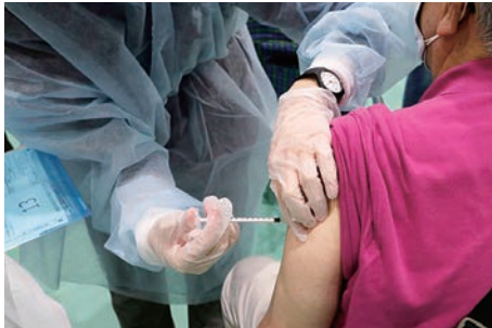
◀ワクチン接種の様子

答 優先接種にあたっては、各職員や施設と事前調整を入念に行うとともに、必要に応じて職務専念義務を免除する。職域でのワクチン優先接種を迅速かつ丁寧に実施し感染拡大防止に努めていく。