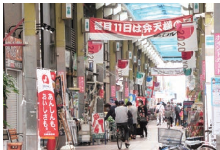
◀ドラマの撮影にも使われるジョイフル三ノ輪商店街

答 区では商店街全体への補助と個店への支援等を通じて賑わいの創出に寄与してきた。産学連携の視点も含め、様々な支援を行っていく。