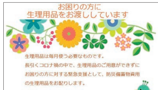
コロナ禍の支援として 生理用品を配布

答 コロナ禍の緊急支援策として実施し、554セット配布した。必要な方に確実に届け、必要な支援に繋げるよう窓口配布としているため、区施設のトイレ内への配置は想定していない。