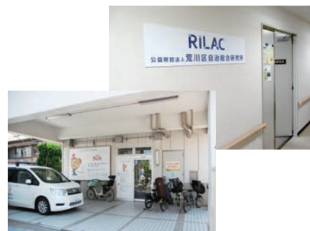
◀調査対象の 荒川区自治総合研究所（右上） 荒川社会福祉協議会（左下）