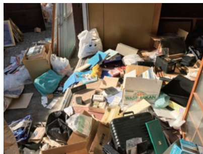
◀ゴミ屋敷のイメージ

答 対象の拡大について、柔軟な対応を行うとともに、助成制度の効果的対策を調査研究していく。