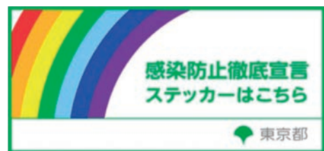
◀感染防止ステッカー

答 ワクチン接種を終えた後についても、引き続き、基本的な感染予防対策が重要であると認識している。様々な機会や手法を駆使して新型コロナウイルスワクチン感染症対策に全力で取り組んでいく。