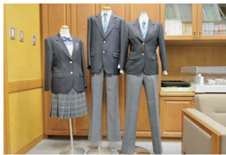
◀区立中学校の女子スラックス(イメージ写真・右)

答 校則は、ジェンダー平等の考えのもと、多様性を認め、自分らしさを発揮できるよう配慮が必要であり、様々な視点から絶えず見直していく。