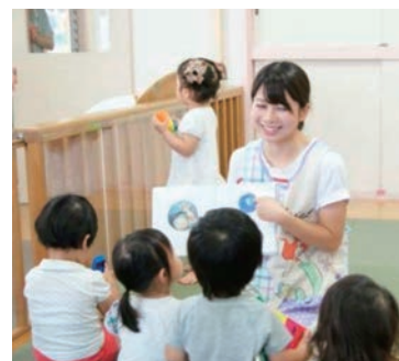
◀保育園で読み聞かせる様子