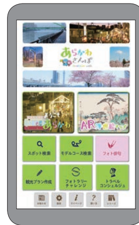
◀観光アプリ等を活用した 地域散策型イベントの実施