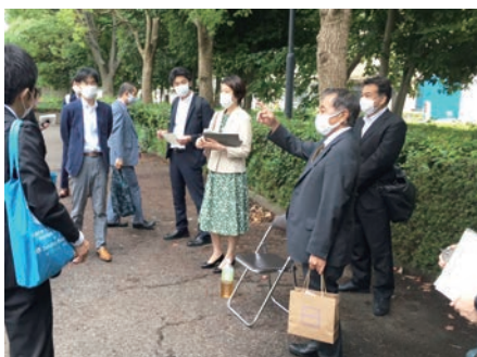
◀ワクチン接種会場視察の様子 （東京都立大学荒川キャンパス）