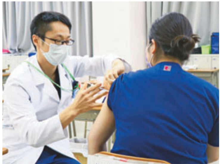
▲接種は肩付近に行いますので、肩を出しやすい服装を着用してください