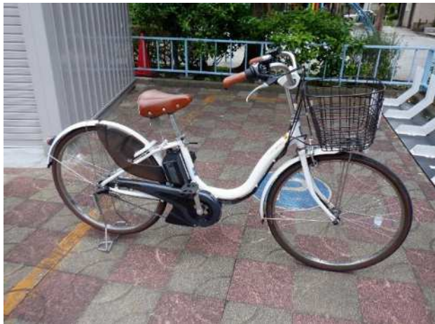
電動アシスト付き自転車