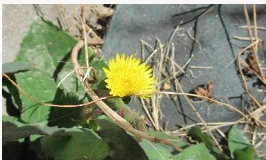
名前：ノゲシ 様子：壁際の草地で黄色の花を咲かせていました。ハルノノゲシと呼ばれますが、冬にも花がよく見られます。 見つけた場所：農園の草地