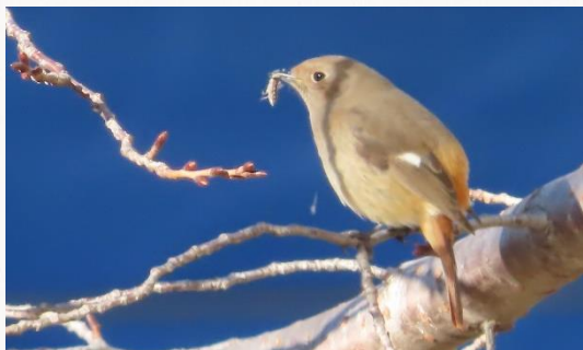
名前：ジョウビタキ 様子：畑の周りの落ち葉に着陸した後、桜の木の上に飛び上がりました。何か虫のようなものを捕まえたようです。 見つけた場所：エコセンターの桜の木