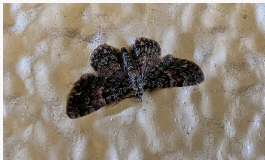
名前：ケブカチビナミシヤク 様子：エコセンターの壁にぴったりと貼りついていました。寒い時期にも見られる小さな蛾です。 見つけた場所：エコセンターの壁