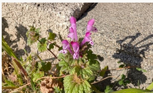
名前：ホトケノザ 様子：草地のあちこちに広がって、紫色の花を咲かせていました。アリが種を運んで分布拡大に貢献するのだそうです。 見つけた場所：農園の草地