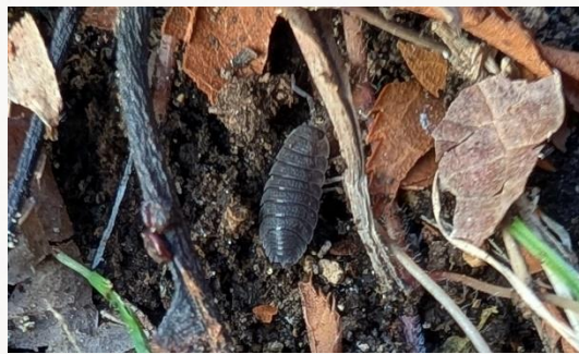
名前：ワラジムシ 様子：球根が植えられた大きな植木鉢を動かすと、その下でゴソゴソと動いていました。 見つけた場所：農園の植木鉢の下