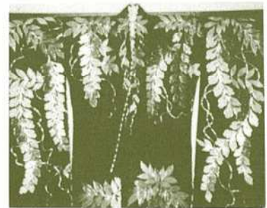
（完成した藤娘の衣裳）