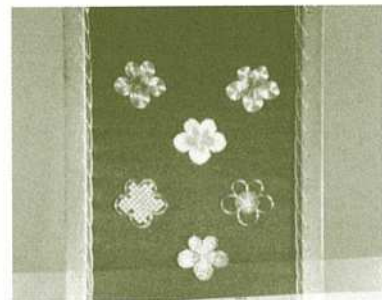
（各種の技法で縫いあげた梅）