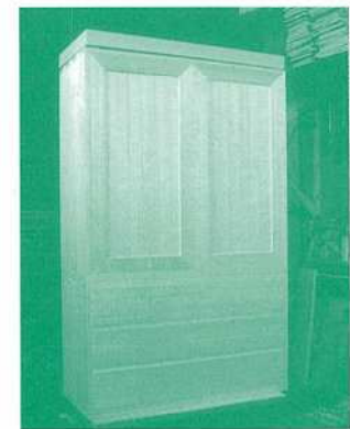
（完成した桐たんす）