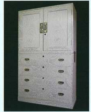
時代仕上げの場合

桐材（会津桐、南部桐）、ポンド、木釘、砥の粉（白、黄）、大和液、ロウ（白・黒）、防水液、金具類（蝶番、引手、前飾り、鍵、棒通し〔棹通し〕など）