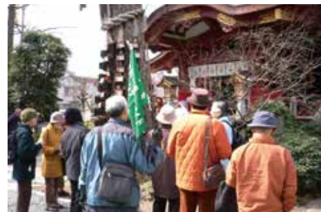
◀観光ボランティアガイドの活動の様子