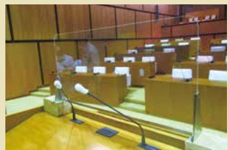
▲本会議場演壇に設置した アクリル板