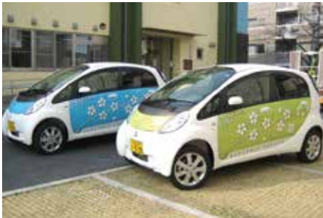
◀ 荒川区庁有車の電気自動車

答 庁有車の電気自動車を増やしていくとともに、受援による具体的な活用方法を定めていく。購入費用助成等についても調査・研究する。