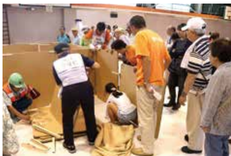
◀ 避難所開設運営訓練の様子

答 日頃から在宅避難の支援体制を整え、被災者生活再建支援システムの習熟に努めている。ICT機器の更なる活用など、避難所の機能強化を図ることで、在宅避難者等への支援体制の更なる充実に努めていく。