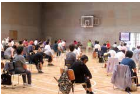
◀ ころばん体操の様子

問 高齢者が介護予防に取り組みやすいように、昨年度9月会議で、小単位で身近な通いの場を増やすことを提案したが、進捗状況と介護予防教室等の小単位での開催について、区の見解を問う。