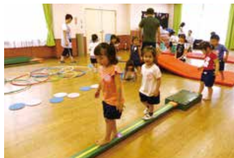
◀ 幼稚園児の運動遊びの様子

答 5月に予定していた、体力向上をテーマにした講演と実技研修は中止し、改めて実施に向けて調整を行っている。幼稚園児の体力測定については、文部科学省が実施している幼稚園向きの調査がないため、幼児の体力測定の種目を各園の運動遊び等に取り入れるなど工夫をしていく。私立保育園についても、指導員による体操教室等を実施し、幼児期からの体力増進に取り組んでいる。