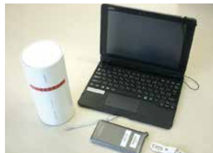
貸出用のタブレットパソコンとWi-Fiルーター

また、様々な用途での活用が進んでいるICTを通常時から積極的に活用し、今後の不測の事態に備えるため、オンライン授業ができる環境整備が必要である。経済面での対応が難しい家庭に対する支援も構築すべきである。こうしたICT環境の整備と効果的な活用について、区の見解を問う。