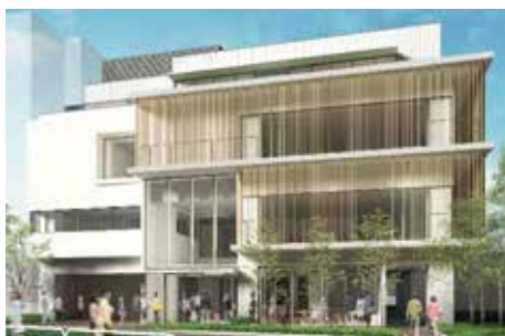
◀ひぐらしふれあい館 完成予想図