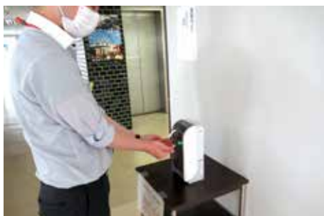
◀感染防止のための手指消毒