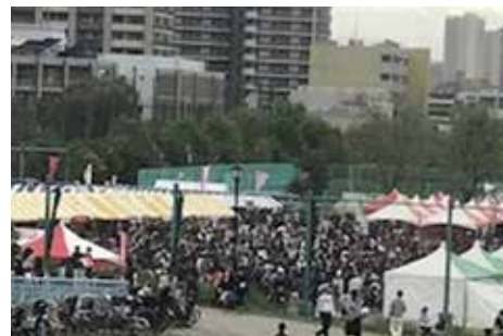
今年中止となった川の手 荒川まつり(昨年度の様子)

答 今後の安定した区政運営を行うために、中止となったイベント等の整理や、休止の可能性のある事業の洗い出しを、行財政改革の視点からも鋭意進めている。さらに、国や都の事業の活用や補助金等の財源確保の徹底など、積極的に進めていく。