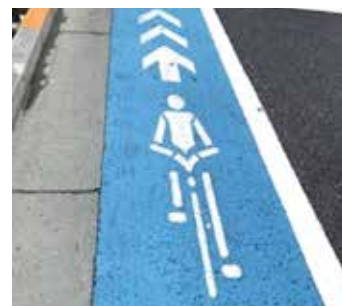
◀尾竹橋通りの自転車通行帯の様子