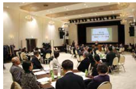
◀財政援助団体の1つRIILACCの活動の様子