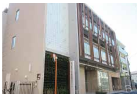
7月に開所された子ども家庭総合センター

答 子どもと家庭の状況を見極める専門的な視点と予防的対応を加えた新しい児童相談体制を目指し、万全の対応で、妊娠期から子育て期までの切れ目ない支援を推進していく。現在のコロナ危機下において、学校や保育園、幼稚園の臨時休業や外出自粛に対しても、サービスを繋げる、アウトリーチ型の支援を展開する体制を整備している。