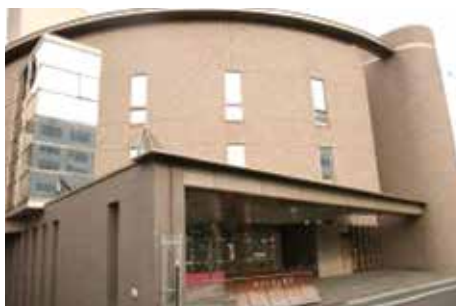
◀特別養護老人ホームサンハイム荒川の外観