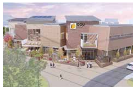
◀新尾久図書館完成予想図