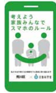
荒川区SNS学校ルール

答 学校ごとにSNSルールを策定し、保護者や児童生徒に情報モラルのルール作りを促すなど、情報モラル教育に積極的に取り組んでいる。