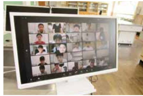
◀オンラインホームルームの様子