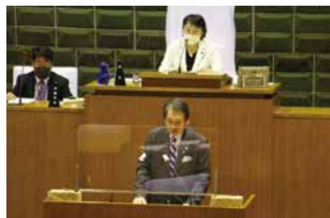
◀ 6月会議の区長答弁