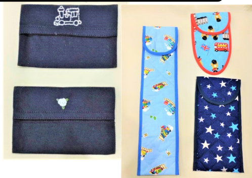
C2 スクールグッズの縫製・刺繍