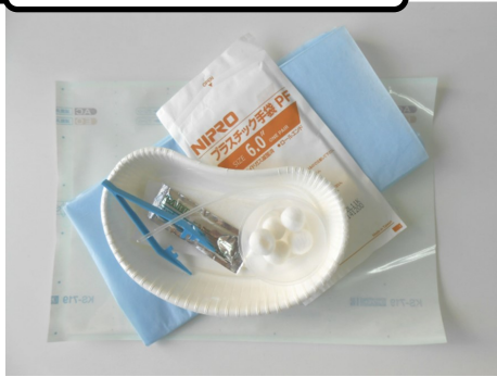
A1 医療用具のセット作成