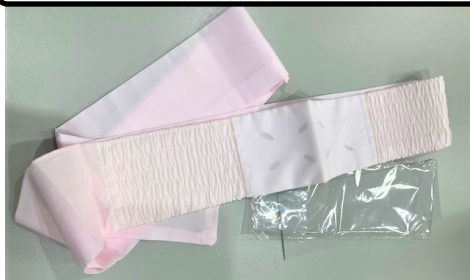
C1 ダテ締め縫製のアイロン掛け等