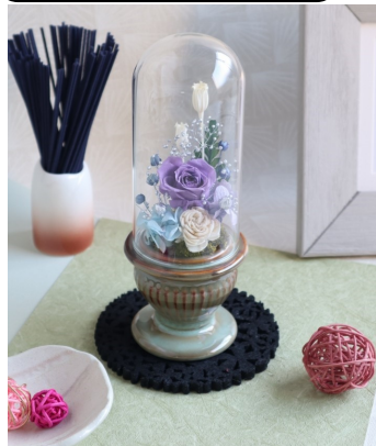
B2 プリザ-ブドフラワーの基礎部分の作成