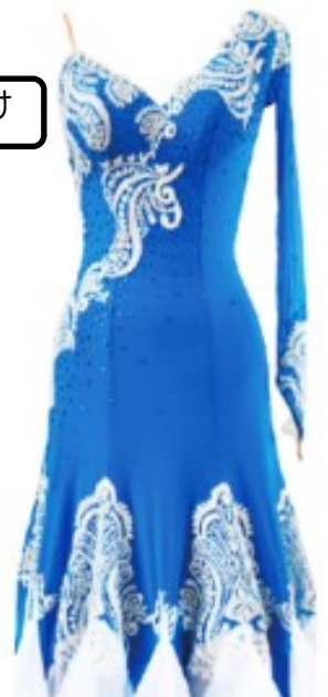
C3 オーダーメイドダンスウェアの縫製