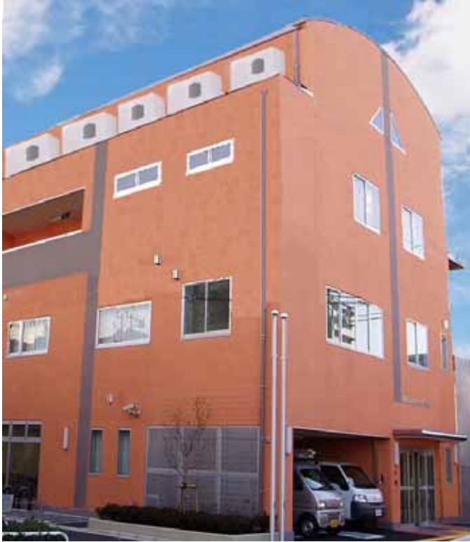
荒川山吹ふれあい館