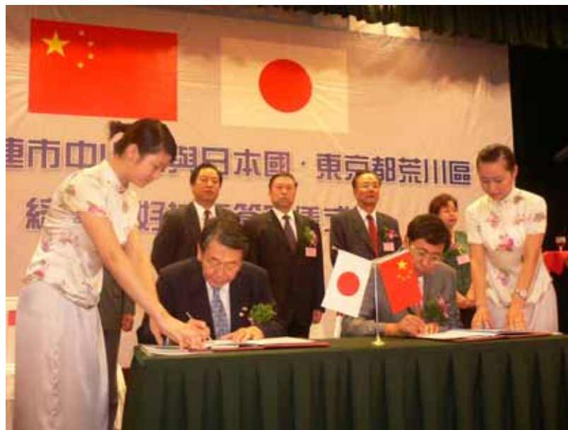
中国大連市中山区との友好都市提携調印式