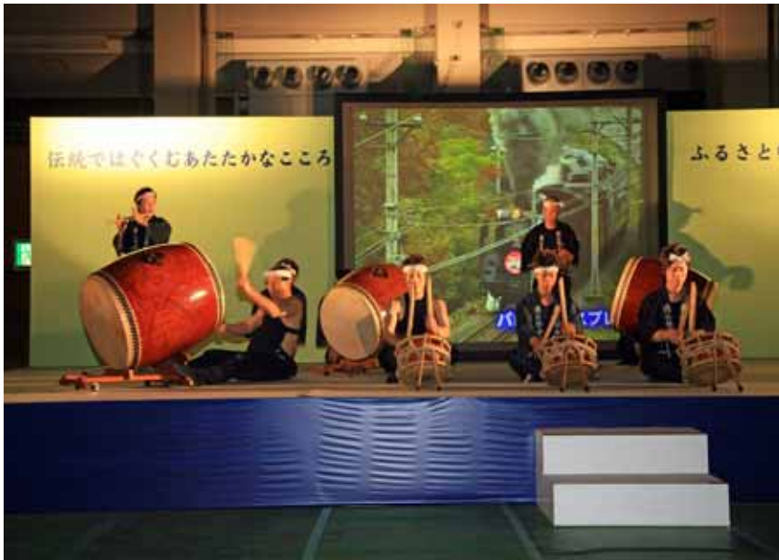
ふるさと郷土芸能の祭典