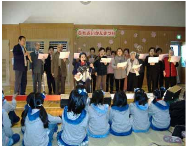
ふれあい館まつり