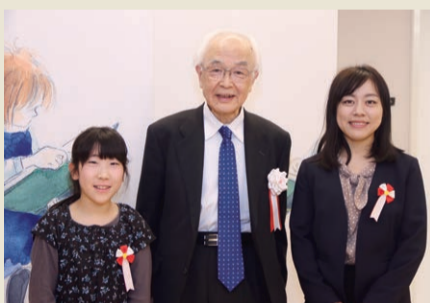
▲大賞受賞者と記念撮影